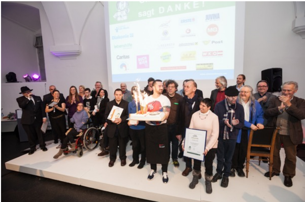
Gruppenfoto vom Ohrenschmaus 2016